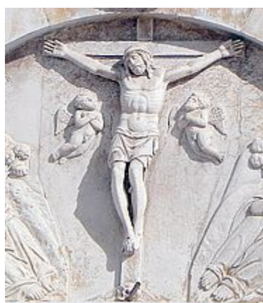
ARTE La lunetta del Duomo di Pietrasanta